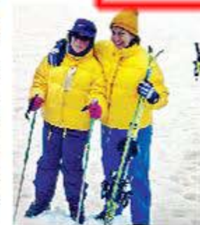
MAGDALENA E HIJA. Un alto en el camino, en Alto Campoo.