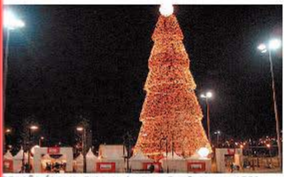
BEGOÑA ÁLAMO. El árbol más alto de España luce en el BEC.