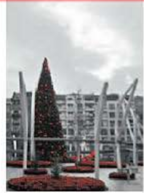
IRATXE FLORES. Indautxu se viste de rojo pasión navideña.