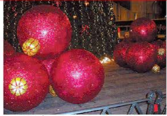
YAIZA CABEZÓN. Grandes bolas al pie del árbol de Indautxu.