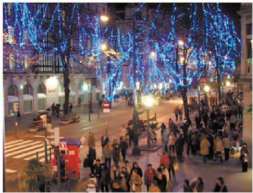
DAVID TIJERO. «Típica estampa: luces, puestos de castañas y personas haciendo compras».